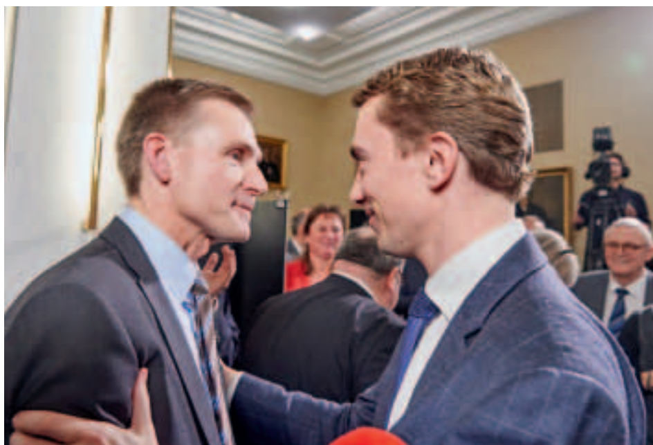
En glad og lettet Morten Messerschmidt fejrede det gode resultat af afstemningen om retsforbeholdet sammen med andre glade DF’ere i Snapstinget på Christiansborg – her i selskab med Kristian Thulesen Dahl.

”Denne valgaften bør i virkeligheden være begyndelsen på noget helt nyt. Demokratiet virker. Vælgerne har talt. Nu er det op til politikerne at lytte. Jeg håber, at splittelsen mellem befolkning og flertallet på Christiansborg er noget, der havner på historiens losseplads. Nu må ja-siden til at vågne op og erkende, at de har været ude af trit med deres vælgere. Det er ikke danskerne, der har taget fejl, men de politikere, som bilder sig ind, at Danmark skal ind til kernen af EU”. •