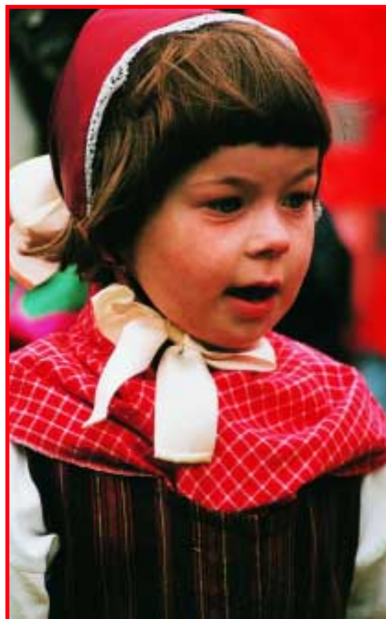
De søde og ivrige børnedansere fra Sønderborg Amts Folkedansere fik et specielt stort bifald.