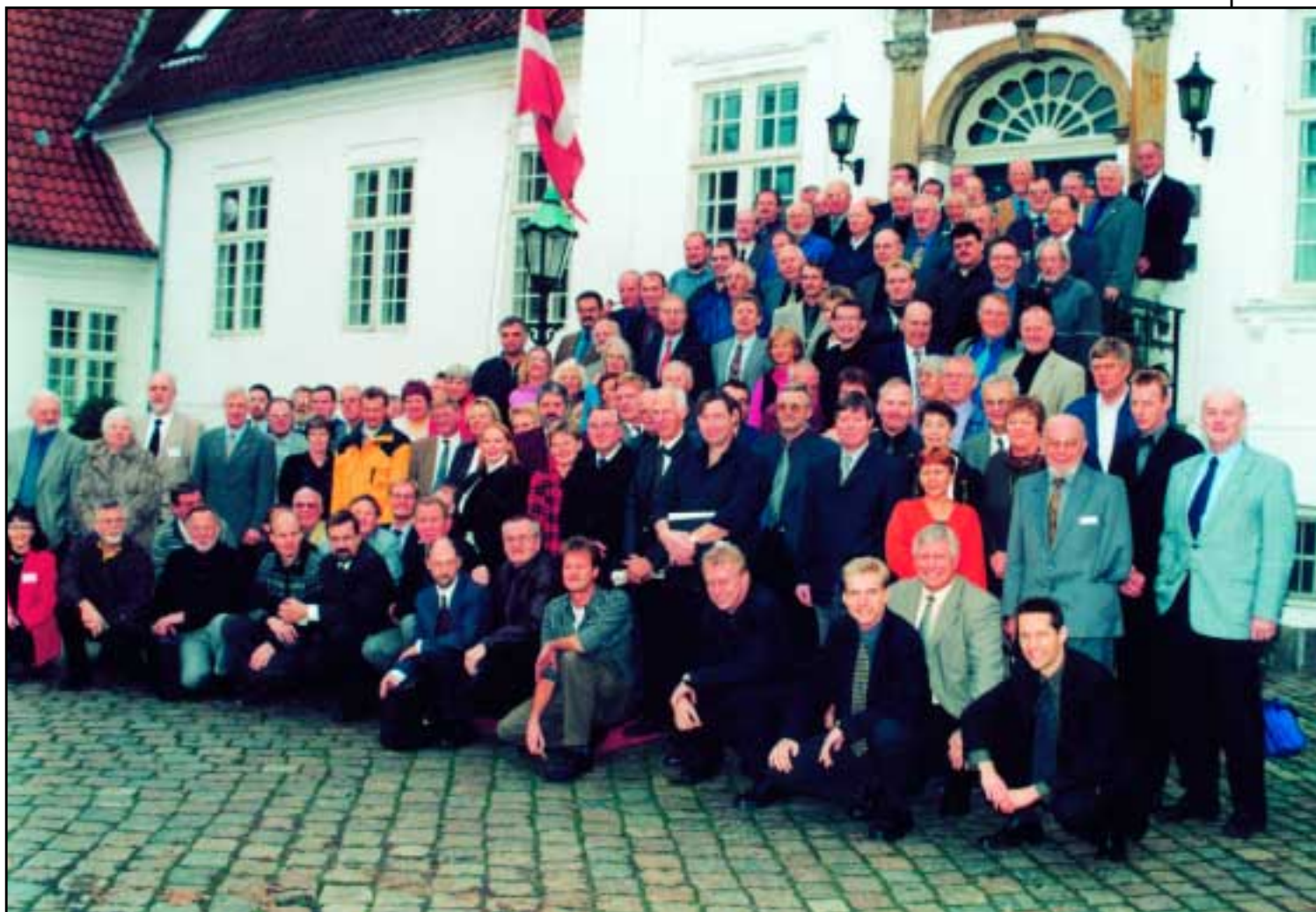
120 DF'ere fra hele landet var søndag den 19. november samlet til tillidsmandsmøde på Bygholm Park Hotel ved Horsens med fokus specielt rettet mod de kommende valg til by- og amtsråd, hvor en række by- og amtsrådsmedlemmer orienterede om det praktiske arbejde, der venter de kommende DF'ere, der vælges ind den 20. november 2001. Et par weekender forinden gjaldt det folketingskandidaterne, som deltog i et kursus på Snoghøj ved Fredericia, hvor der bl.a. gennemførtes et såkaldt rollespil, hvor kandidaterne var opdelt i forskellige partier, som skulle behandle lov- og beslutningsforslag. I det kommende år frem mod valgene vil kursusaktiviteten blive yderligere optrappe