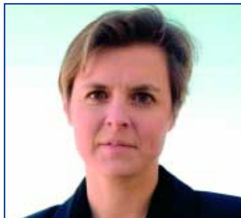
Den hurtigt-talende Lykke Friis er altid klar til at forklare danskerne, hvad de skal mene om EU. Hun har været Robert Schuman Stipendiat ved Europa-Parlamentet og har ph.d.-grad i europæisk integration.