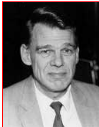
Jesper Langballe - på vej i Folketinget for DF

Efter præsteuddannelsen fik han i 1975 kald som sognepræst i Thorning mellem Silkeborg og Kjellerup. Langballe er kendt som en skarp og aktiv samfundsdebatør igennem mange år. Han er medudgiver af "Tidehverv".